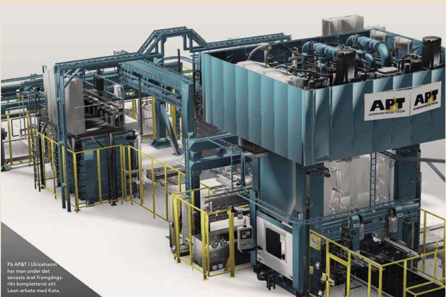
På AP&T i Ulricehamn har man under det senaste året framgångsrikt kompletterat sitt Lean-arbete med Kata.